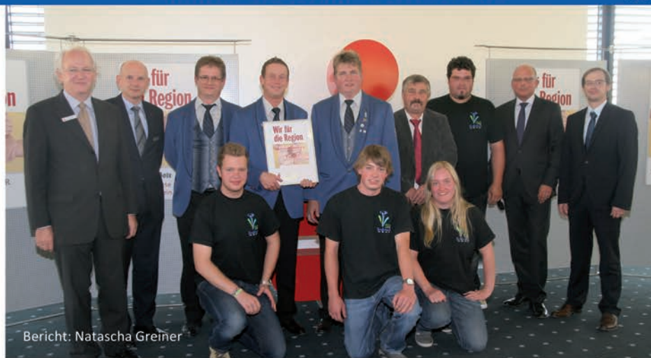
Bericht: Natascha Greiner