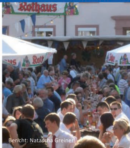
Bericht: Natascha Greiner