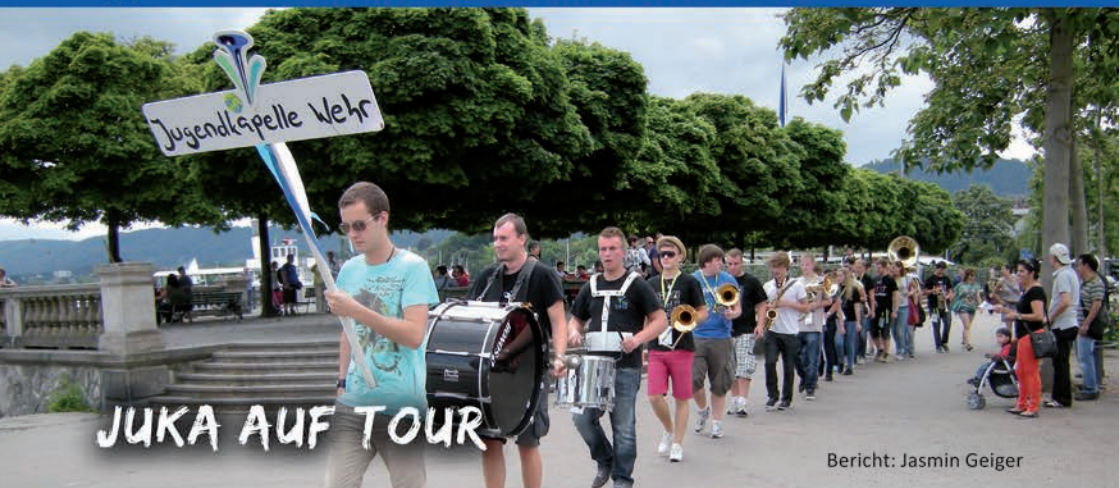
Bericht: Jasmin Geiger

Die Jugendkapelle Wehr fuhr am Freitag, den 6. Juli 2012 um 12 Uhr ab nach Zürich. Nach langer Vorbereitung war es endlich so weit, das 6. Weltjugendmusik Festival stand vor der Tür. 59 Jugendorchestern mit insgesamt 3600 Musikern aus der ganzen Welt nahmen an diesem weltbekannten Ereignis teil und mittendrin war die Jugendkapelle Wehr. Neben dem Wertungsspiel, standen auch der große Festumzug, einige Platzkonzerte, eine Eröffnungsfeier und vieles mehr auf dem Programm.